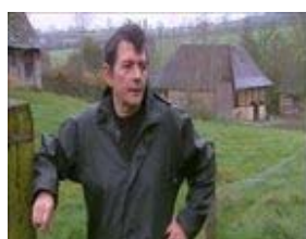
G : n°...