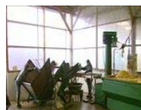
H : n°...