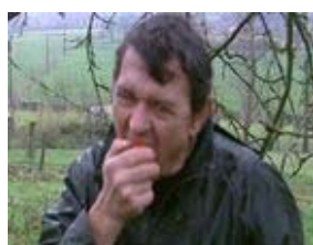
B : n°...