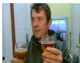
C : n°...