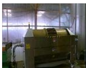
A : n°...

Remettez dans l'ordre les différentes images du reportage.