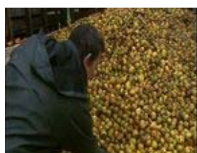
E : n°...