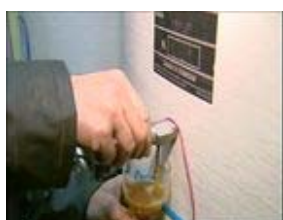
F : n°...