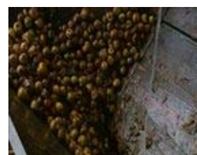
D : n°...