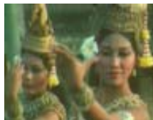
La danse cambodgienne

Activité 3 - Relevez les éléments qui caractérisent les arts évoqués dans les interventions du commissaire de l'exposition et du prince Sisowath Tesso.