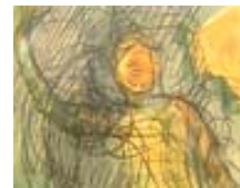
Les dessins de Rodin